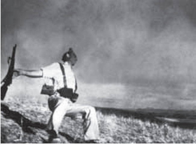
İç savaşta vurulan Cumhuriyetçi...

1936-1939 İspanya'sı üzerine çok şey yazıldı, çok şey söylendi; ama hala savaşta ölenlerin sayısı bile belli değildir. Ya boğanın ya da matadorun ölüm çığlığının duyulmadan arenaların terk edilmediği İspanya'da, Cumhuriyetçilerin ve Milliyetçilerin ayrı iç savaş tarihleri vardır. Bu yüzden ölenlerin sayısının iki yüz bin ile bir milyon arasında değiştiği söylenir.